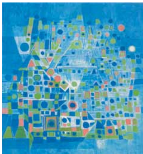
Espace musical en bleu-clair, 2013 huile sur bois, 73 x 68 cm