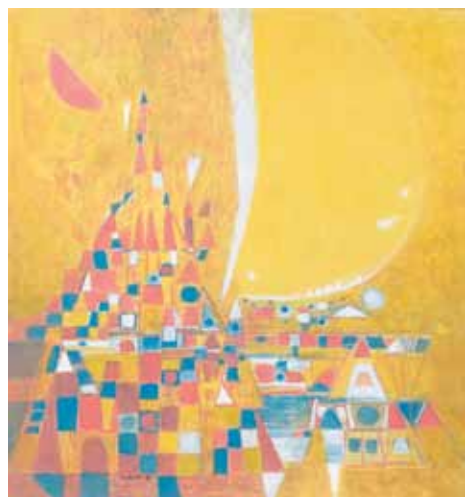
Cité et grande lune jaune, 2013 huile sur bois, 73 x 68 cm